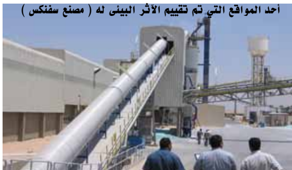
أحد المواقع التي تم تقييم الأثر البيئي له ( مصنع سفنكس )